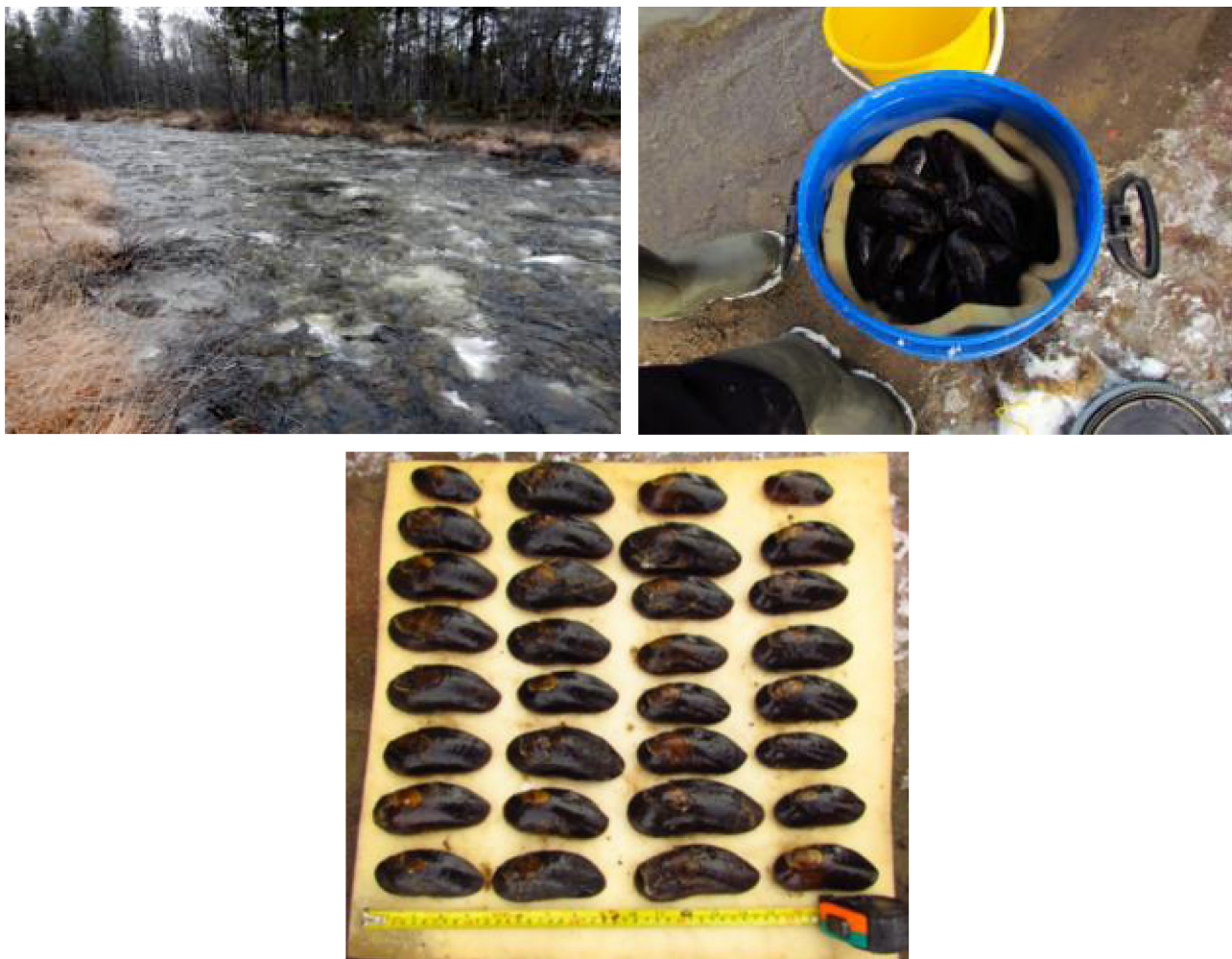
Рис. 1. Ручей Машъйоки (бассейн Баренцева моря), отлов моллюсков (Д.А. Ефремов)