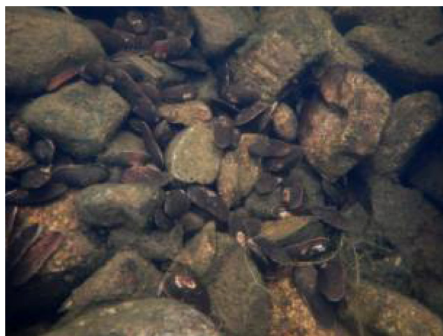
Рис. 3. р. Каскамайоки, участок высадки первой группы моллюсков