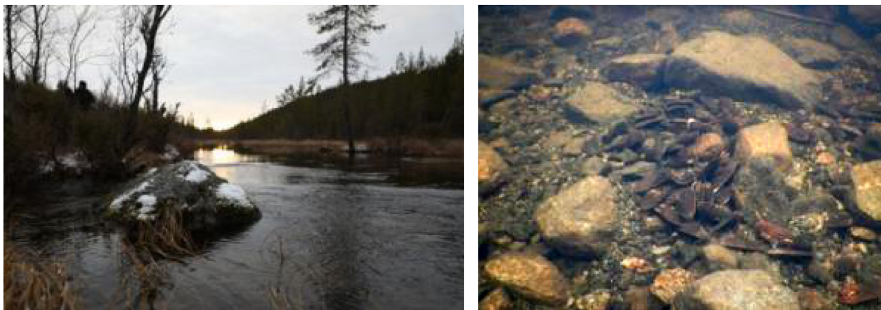
Рис. 4. р. Каскамайоки, участок высадки второй группы моллюсков (Д.А. Ефремов)