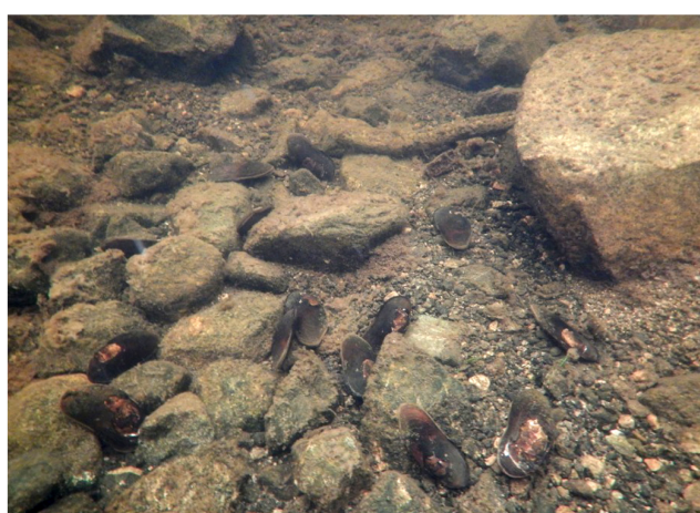
Рис. 6. Участок ручья Каскамайоки, середина ручья, жемчужница группа 2, 100 особей, август 2025 г. (Д.А. Ефремов)